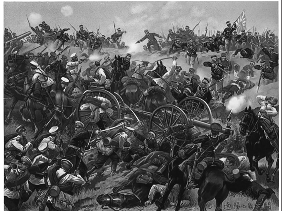
Сражение под Ляоянем (Янтайские копи подступы к городу), август 1904 года